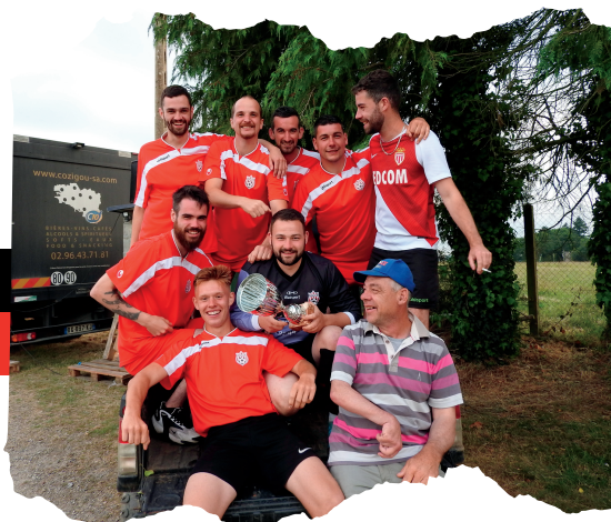
"L'équipe de Nenoëil" Vainqueur de la Consolante