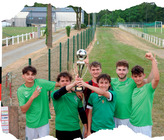
"Les Verts" Vainqueurs du Tournoi