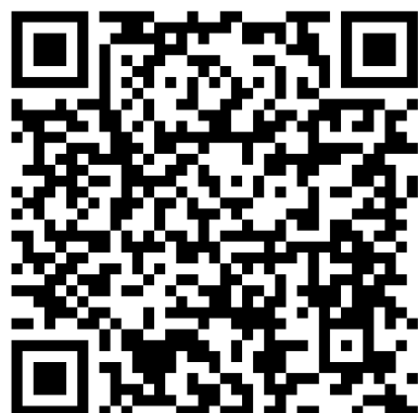
TOURNOI DE SIXTE