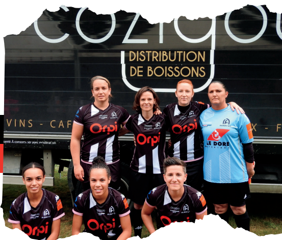
FC Auray Remporte le tournoi