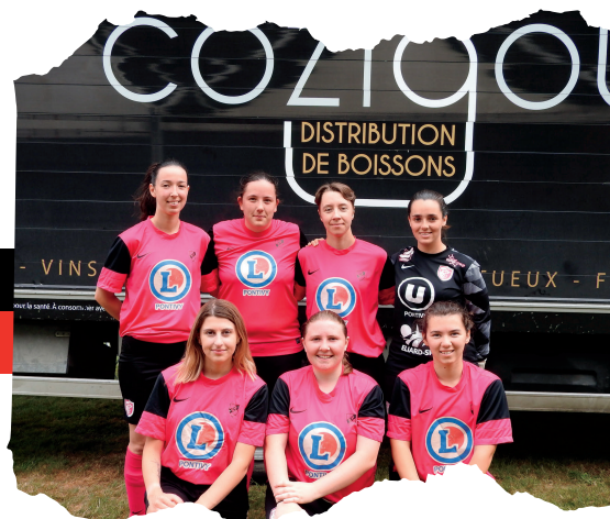
P2F (Pontivy) Finaliste